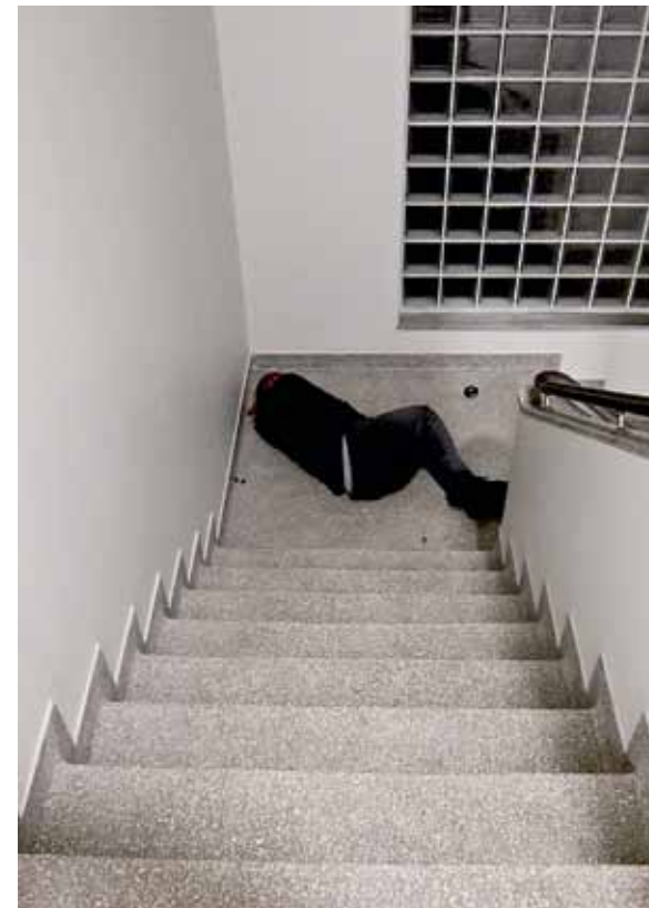
MISTET NØKKELEN? Det kan skje den beste.